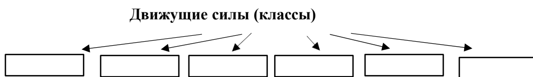
Схема. Движущая сила Февральской революции 1917 года

Класс-гегемон (класс-руководитель данной революции): _____